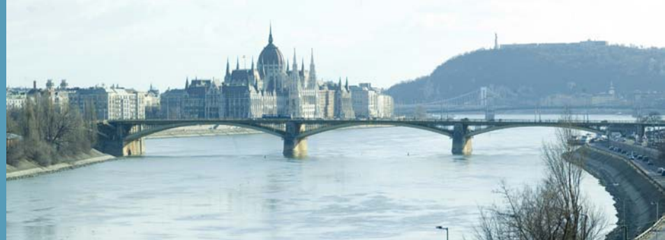
Kilátás a teraszról / View from the terrace